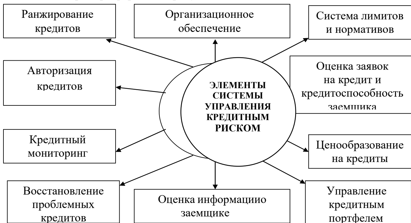
Рис. 2.2. Элементы системы управления кредитным риском