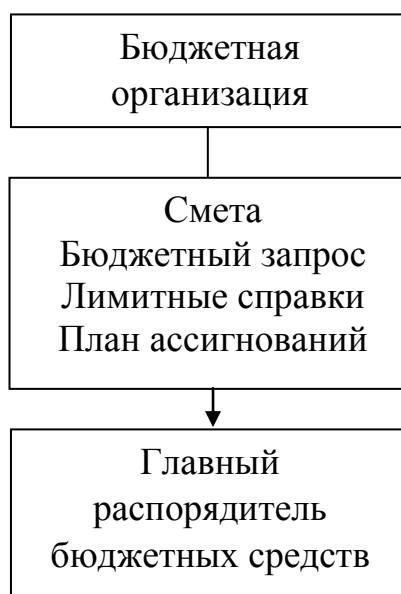
Рис. 1.2. Формирование финансовых ресурсов

Иллюстрации помечают словом «Рис.» и нумеруют последовательно в пределах раздела, за исключением иллюстраций в приложениях. Номер иллюстрации должен состоять из номера раздела и порядкового номера иллюстрации, между которыми ставится точка: например, «Рис. 1.2.» (второй рисунок первой главы). Номер иллюстрации, ее название и объяснительные подписи размещаются последовательно под иллюстрацией по центру. Например: