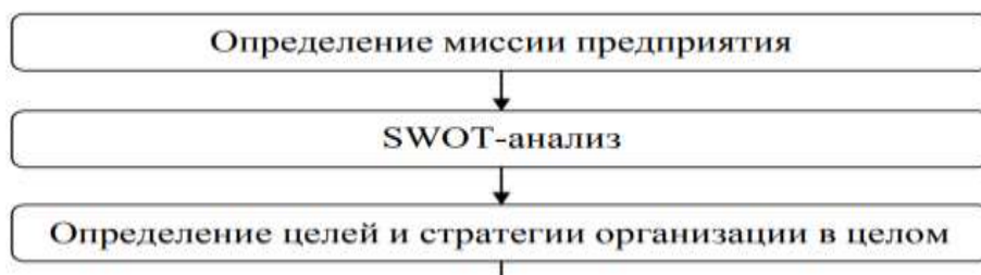
Рис. 1.2. Второй рисунок первой главы

5.3.3. Иллюстрации обозначают словом (рис.) и нумеруют последовательно в пределах главы, за исключением иллюстраций в приложениях. Номер иллюстрации должен состоять из номера главы и порядкового номера иллюстрации, разделенных точкой: например, Рис. 1.2. (второй рисунок первой главы). Номер иллюстрации, ее название и пояснительные подписи размещают последовательно под иллюстрацией по центру. Например: