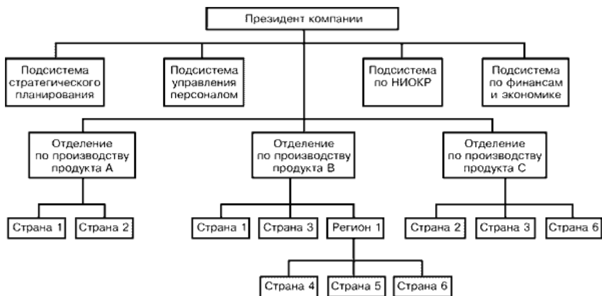
Рис.2.1. Глобально-ориентированная продуктовая (товарная) структура