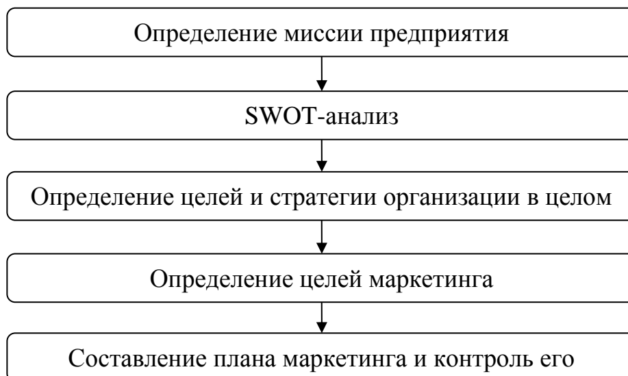
Рис. 1.2. Второй рисунок первой главы