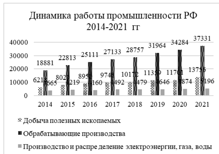
Рис. 3. Динамика основных показателей работы промышленности РФ за 2014-2021 гг. (млн. руб.)

Анализ основных показателей предоставляет возможность утверждать о нисходящей динамике среднегодовой численности работников предприятий РФ и восходящей – по основным их