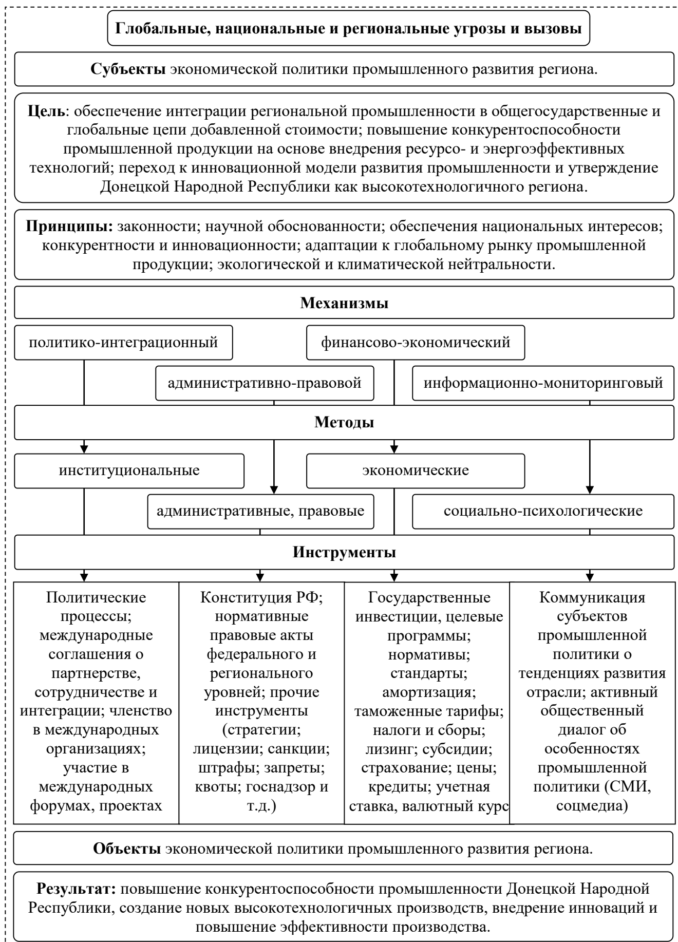
Рисунок 6 – Система формирования и реализации экономической политики промышленного развития Донецкой Народной Республики