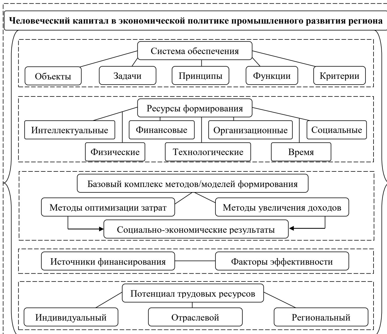
Рисунок 4 – Роль человеческого капитала как концептуального компонента в экономической политике промышленного развития региона

Доказано, что обеспечение приоритетного расширенного воспроизводства человеческого капитала в промышленности (рисунок 4) является комплексной задачей, которая может быть решена на основе сотрудничества государственных и региональных институций, отдельных представителей общества и субъектов промышленной отрасли.