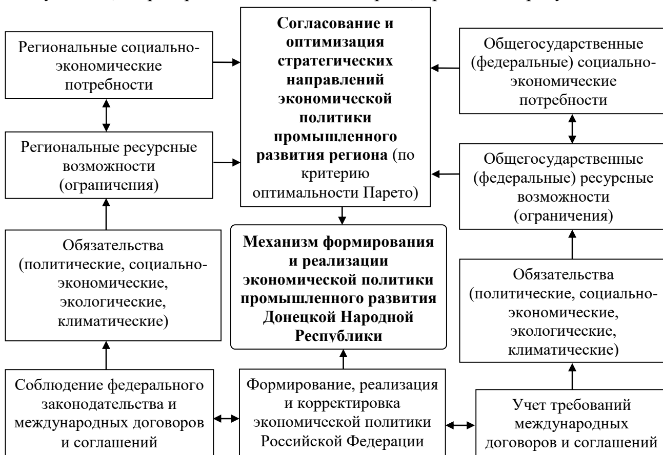
Рисунок 5 – Процесс оптимизации стратегических направлений экономической политики промышленного развития Донецкой Народной Республики

Стратегическими ориентирами долгосрочной экономической политики промышленного развития Донецкой Народной Республики являются экономическая и социальная эффективность, а также экологическая безопасность. Для достижения указанных ориентиров, повышения управляемости процессов развития промышленности региона существует необходимость формирования и реализации основных составляющих экономической политики промышленного развития Донецкой Народной Республики. К числу таких составляющих относятся, прежде всего, рациональное недропользование и ресурсо- и энергоэффективность промышленного производства, социальная и экологическая политика в промышленной сфере. Алгоритм оптимизации стратегических направлений экономической политики промышленного развития Донецкой Народной Республики (по критерию оптимальности Парето) приведен на рисунке 5.