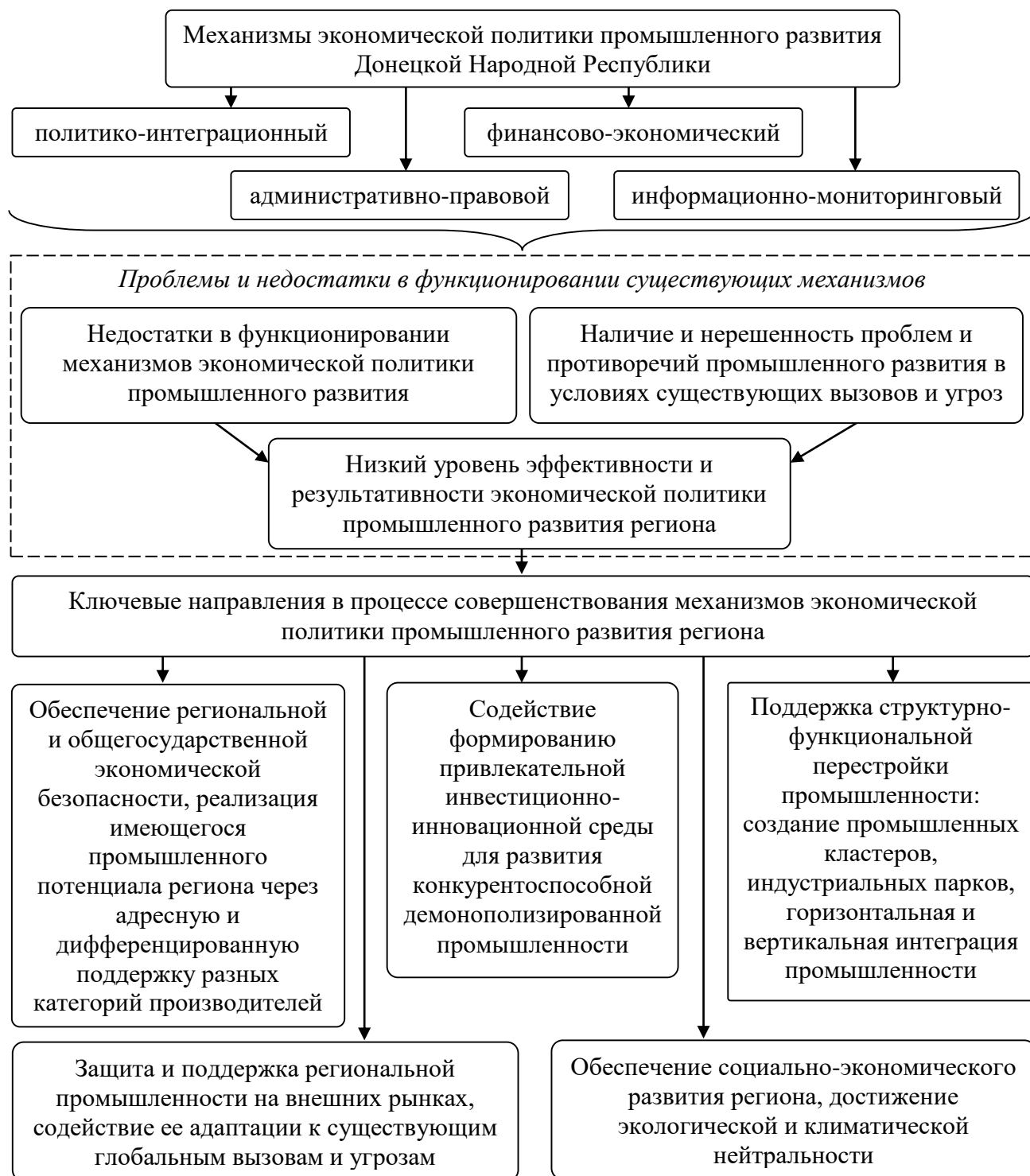
Рисунок 7 – Направления совершенствования механизмов экономической политики промышленного развития Донецкой Народной Республики

Обосновано, что совершенствование экономической политики промышленного развития ДНР целесообразно реализовывать по выделенным механизмам (рисунок 7): политико-интеграционный, административно-правовой, финансово-экономический, информационно-мониторинговый.