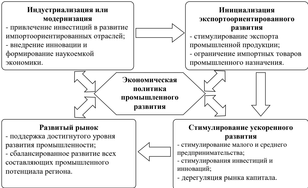
Рисунок 2 – Особенности экономической политики в сфере промышленности в зависимости от стадии экономического развития

Формирование и реализация инструментария экономической политики промышленного развития находится в прямой зависимости от стадии экономического развития региона и/или государства в целом (рисунок 2).