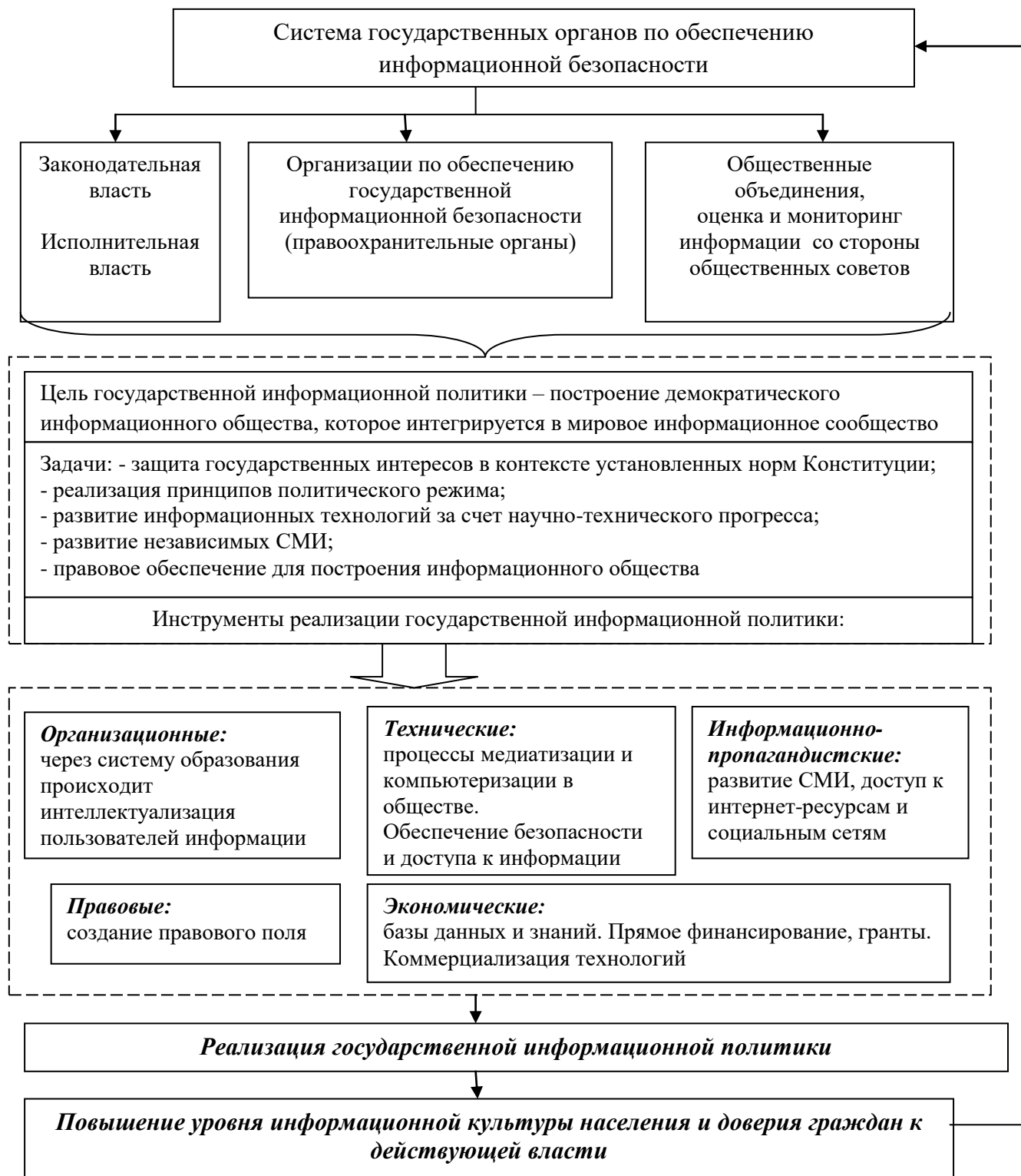
Рисунок 2 – Механизм повышения уровня информационной культуры населения

Авторское представление механизма повышения уровня информационной культуры населения определяет, что он нацелен на повышение уровня доверия граждан к существующей власти. Работа такого механизма способствует целенаправленной осознанной деятельности человека в рамках правового поля на основе сочетания организационных, экономических, правовых, технических и информационно-пропагандистских