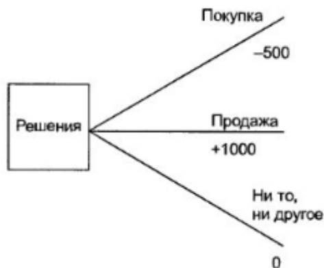
Рис. 1. Покупать, продавать, ни то, ни другое (держат)

Сначала необходимо решить, что делать с акциями: купить еще, все продать или все держать. Это отображено с помощью дерева решений на рис. 1.