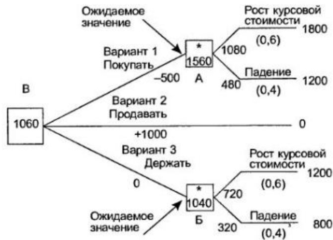
Рис. 3. Ожидаемые значения

Следует отметить, что этот простой способ принятия решений, основанный на максимизации ожидаемой отдачи, может не всегда оказаться приемлемым. Например, также необходимо учитывать факторы риска, о чем мы будем говорить в следующем примере.