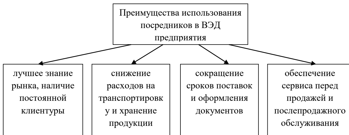
Рис.1.1. Преимущества использования посредников в ВЭД.