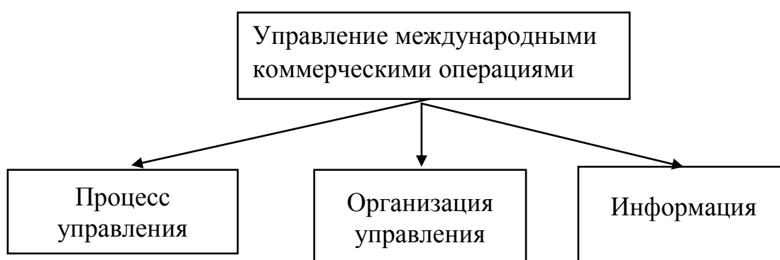
Рис.1. Сущность системы управления коммерческими операциями в сфере ВЭД

Сущность системы управления международными коммерческими операциями субъектов международного бизнеса представлена на рис. 1.