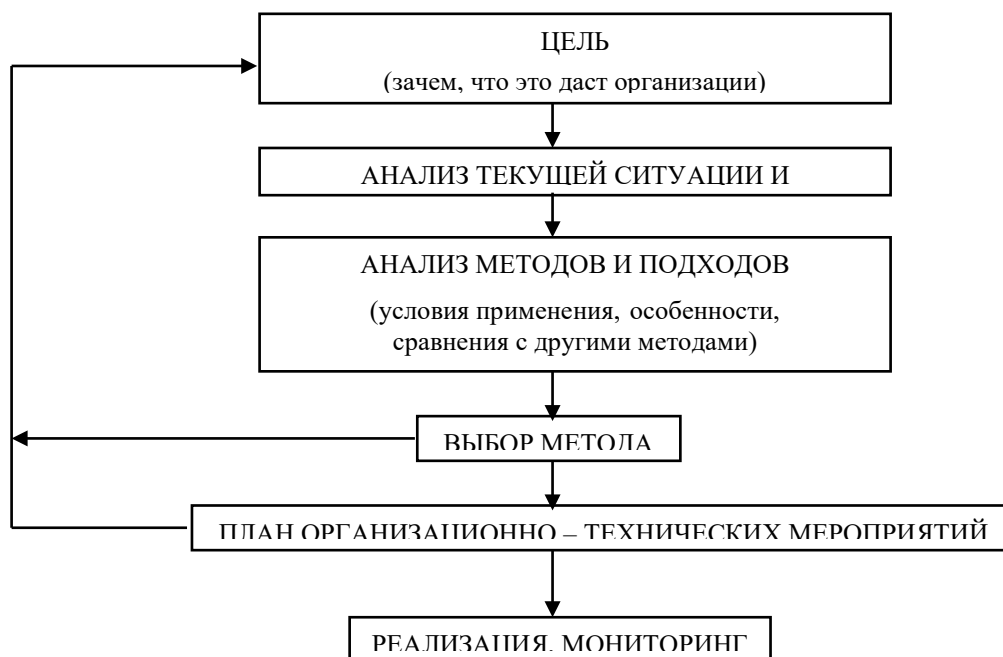
Рис. 1.2. Разработка процесса аттестации персонала

5.3.3. Таблицы нумеруют последовательно (за исключением тех, что размещены в Приложениях) в пределах глав. В правом верхнем углу размещают надпись Таблица с указанием ее номера, который состоит из номера раздела и порядкового номера таблицы, разделенных точкой: например, Таблица 2.3 (третья таблица второй главы). Название таблицы находится ниже, по центру страницы.