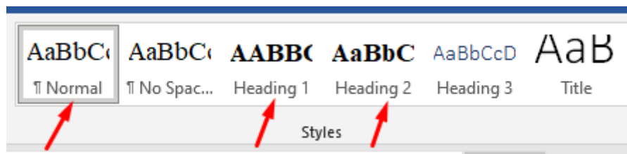
Рис.1. Стили, которые необходимо определить перед началом работы

Автором в обязательном порядке перед началом работы должны быть определены три стиля: Обычный , Заголовок 1 и Заголовок 2 (рис.1).