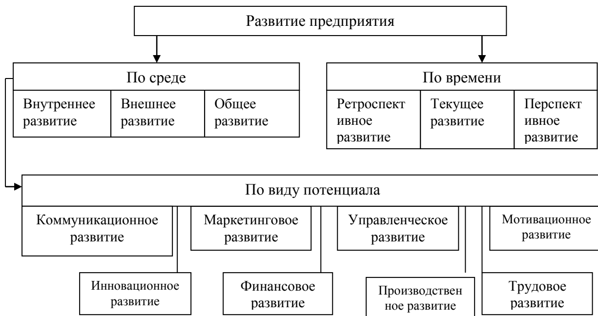
Рис. 1.2. Классификация видов развития предприятия