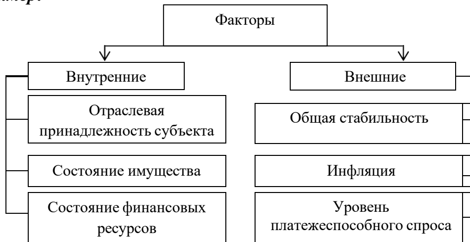
Рис. 1.2. Факторы, влияющие на финансовую устойчивость предприятия

Таблицы нумеруют последовательно в пределах глав (за исключением тех, которые размещены в Приложениях). В правом верхнем углу размещают надпись: «Таблица» с указанием ее номера, который состоит из номера главы и порядкового номера таблицы, разделенных точкой: например, Таблица 2.3 (третья таблица второй главы). Название таблицы размещается ниже, по центру страницы.