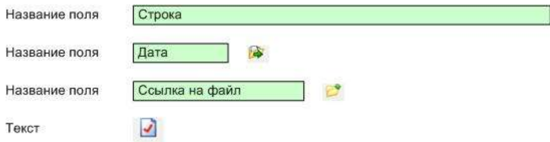
Рис. 4. Поля элемента контента

3. Список элементов контента – состоит из набора элементов контента.