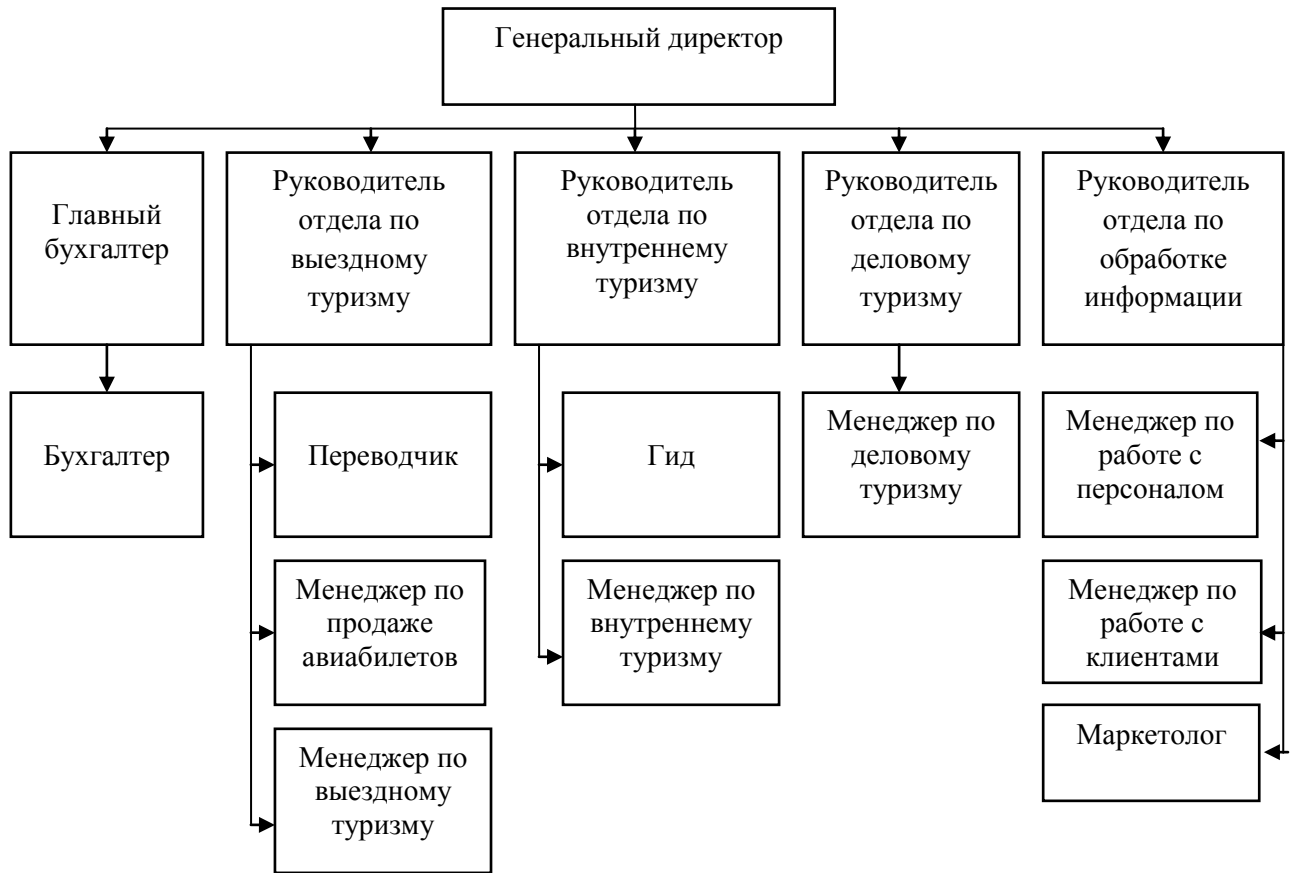
Рис. 1.1. Организационная структура управления туристической фирмой