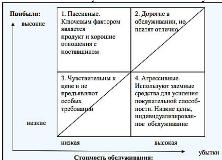
Рис. 1. - Матрица «Прибыль - стоимость обслуживания клиента»

Вопросы и задания. Представьте классификацию клиентов по их прибыльности, расположив их в один из четырех квадратов матрицы «Прибыль - стоимость обслуживания клиента». Обоснуйте свои решения.