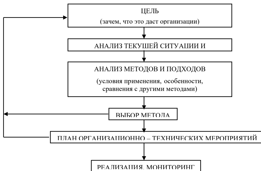
Рис. 1.2. Разработка процесса аттестации персонала

5.3.3. Таблицы нумеруют последовательно (за исключением тех, что размещены в Приложениях) в пределах глав. В правом верхнем углу размещают надпись Таблица с указанием ее номера, который состоит из номера раздела и порядкового номера таблицы, разделенных точкой: например, Таблица 2.3 (третья таблица второй главы). Название таблицы находится ниже, по центру страницы.