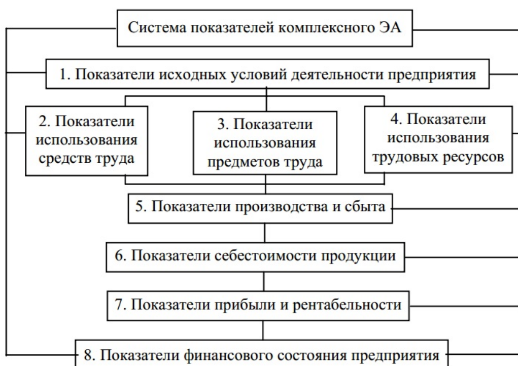
Рис. 2.1. Система показателей комплексного анализа хозяйственной деятельности

Графическое представление статистических данных, наглядно показывающее соотношение между ними, называется диаграммой. По форме строения диаграммы делятся на линейные, плоскостные и изобразительные. Чаще всего в курсовой работе используют линейные, а из плоскостных – столбчатые и круговые диаграммы.