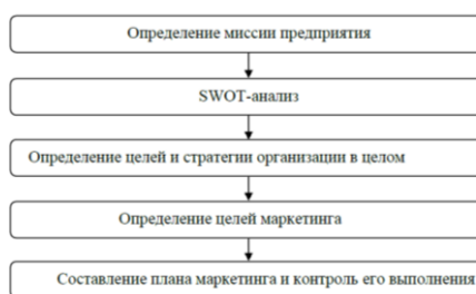
Рис. 1.2. Процесс планирования маркетинга на предприятии

5.3.3. Иллюстрации обозначают словом (рис.) и нумеруют последовательно в пределах главы, за исключением иллюстраций в приложениях. Номер иллюстрации должен состоять из номера главы и порядкового номера иллюстрации, разделенных точкой: например, рис. 1.2. – второй рисунок первой главы. Номер иллюстрации, ее название и пояснительные подписи размещают последовательно под иллюстрацией по центру.