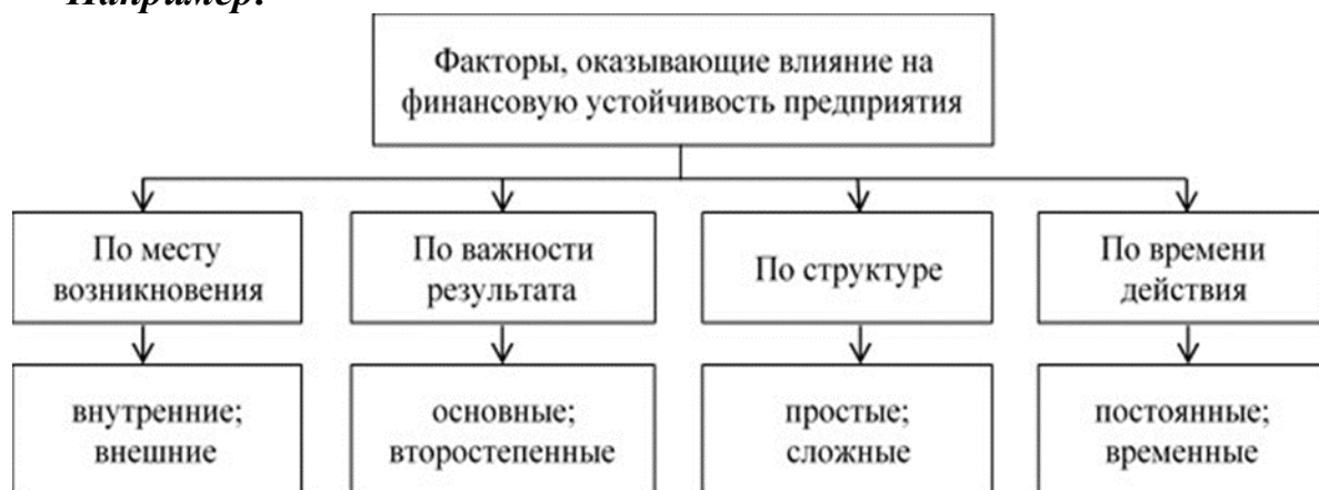
Рис. 1.2. Классификация факторов, влияющих на финансовую устойчивость предприятия