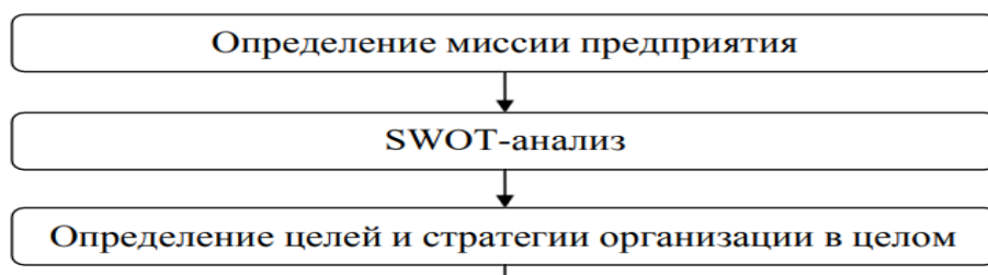
Рис. 1.2. Второй рисунок первой главы

5.3.3. Иллюстрации обозначают словом (рис.) и нумеруют последовательно в пределах главы, за исключением иллюстраций в приложениях. Номер иллюстрации должен состоять из номера главы и порядкового номера иллюстрации, разделенных точкой: например, Рис. 1.2. (второй рисунок первой главы). Номер иллюстрации, ее название и пояснительные подписи размещают последовательно под иллюстрацией по центру. Например: