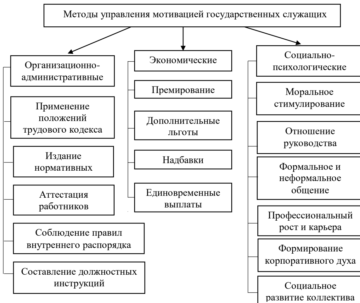
Рис. 1.3. Методы управления мотивацией государственных служащих

Иллюстрации обозначают словом (рис.) и нумеруют последовательно в пределах главы, за исключением иллюстраций в приложениях. Номер иллюстрации должен состоять из номера главы и порядкового номера иллюстрации, разделенных точкой: например, Рис. 1.2. (второй рисунок первой главы). Номер иллюстрации, ее название и пояснительные подписи размещают последовательно под иллюстрацией по центру. Например (рис. 2.2):