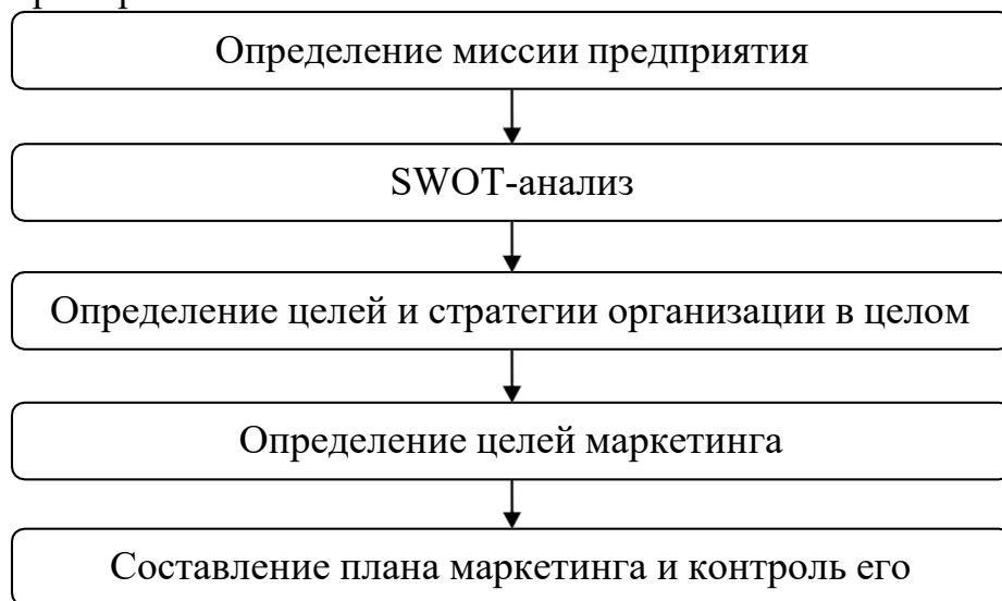
Рис. 1.2. Второй рисунок первой главы

6.3.3. Иллюстрации обозначают словом (рис.) и нумеруют последовательно в пределах главы, за исключением иллюстраций в приложениях. Номер иллюстрации должен состоять из номера главы и порядкового номера иллюстрации, разделенных точкой: например, Рис. 1.2. (второй рисунок первой главы). Номер иллюстрации, ее название и пояснительные подписи размещают последовательно под иллюстрацией по центру. Например: