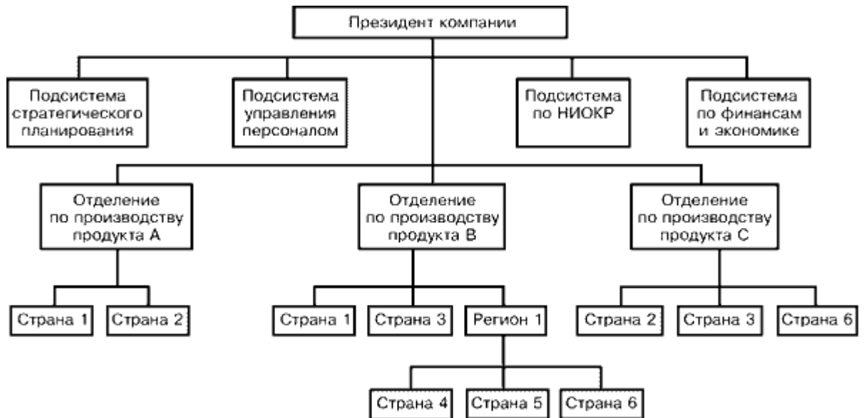
Рис.2.1. Глобально-ориентированная продуктовая (товарная) структура