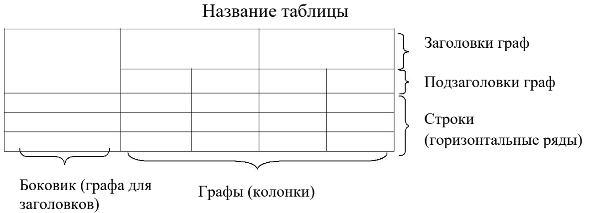
Рис.1.1. Структура и вид таблицы