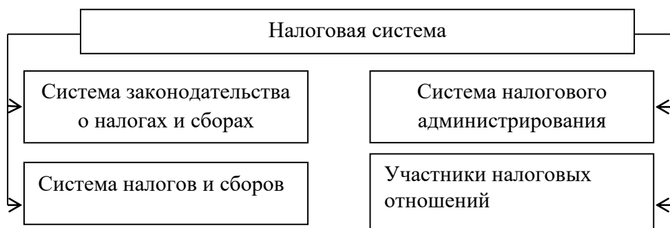
Рис. 1.2. Второй рисунок первой главы

Если иллюстрация заимствована или рассчитана по данным статистического ежегодника или другого литературного источника, надо обязательно делать ссылку на первоисточник. Допускается применять размер шрифта в иллюстрации меньший, чем в тексте (но не менее 12 кегля). Допускается применять одинарный междустрочный интервал.