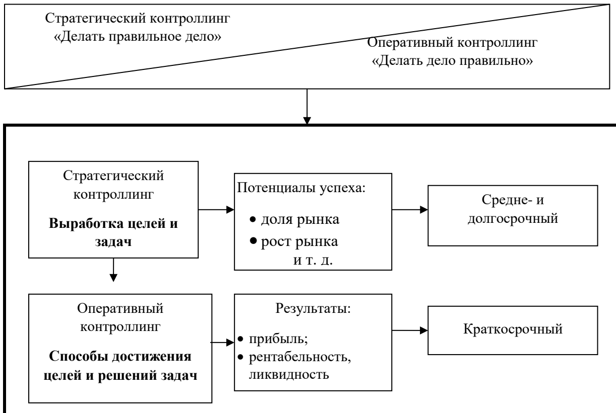
Рис. 1. Разграничение стратегического и оперативного контроллинга

Задание 2. Охарактеризовать отличия стратегического и оперативного контроллинга, используя характеристики на рис. 1.