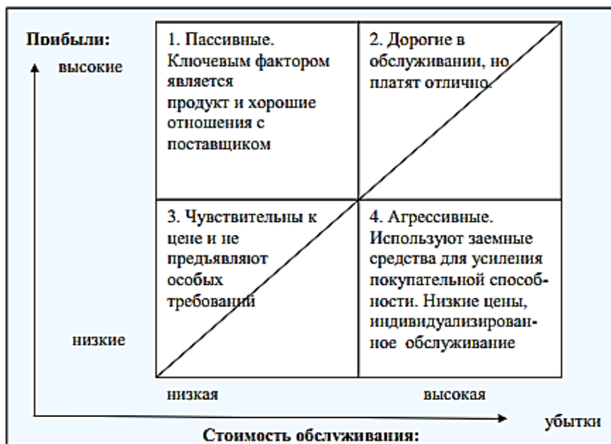
Рис. 1. - Матрица «Прибыль - стоимость обслуживания клиента»

Какие из перечисленных мероприятий по управлению прибыльностью клиентов Вы бы порекомендовали банку в отношении каждой из перечисленных групп.