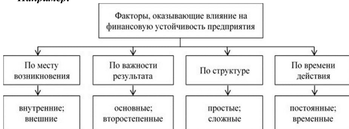
Рис. 1.2. Классификация факторов, влияющих на финансовую устойчивость предприятия