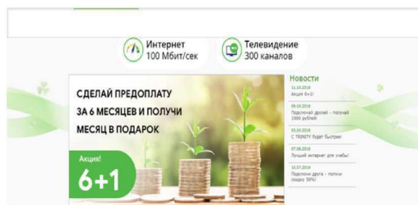
Рис. 5.3. Пример оформления «Приложения»

Реклама продвижения бренда компании «Тринити» – «Сделай предоплату за 6 месяцев и получи месяц в подарок»