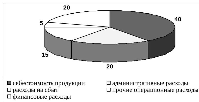
Рис. 2.4. Структура затрат предприятия