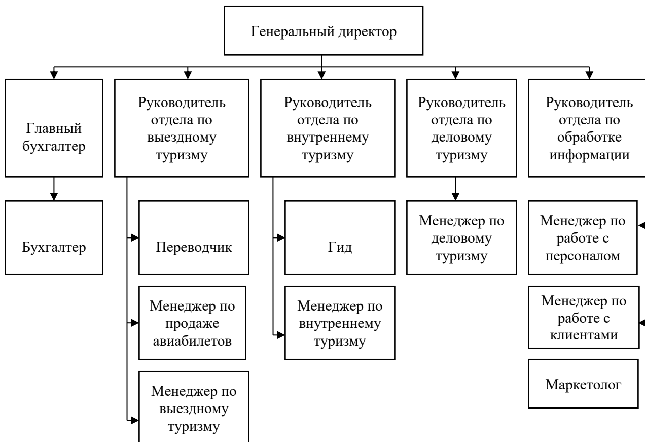
Рис. 1.1. Организационная структура управления туристической фирмой