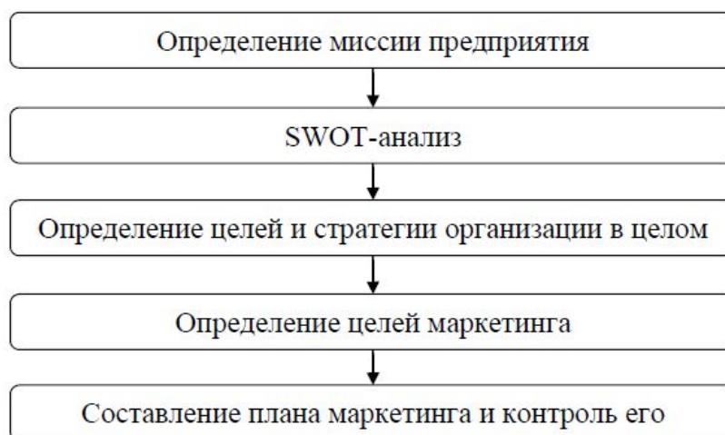
Рис. 1.2. Второй рисунок первой главы

Иллюстрации обозначают словом (рис.) и нумеруют последовательно в пределах главы, за исключением иллюстраций в приложениях. Номер иллюстрации должен состоять из номера главы и порядкового номера иллюстрации, разделенных точкой: например, Рис. 1.2. – второй рисунок первой главы.