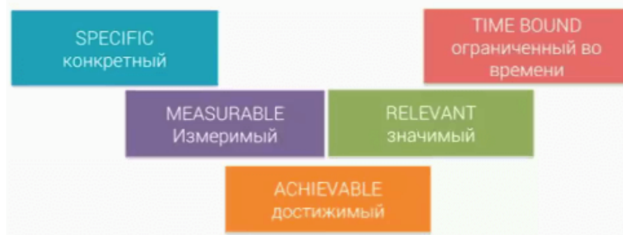
Рисунок 1 – Критерии целей по модели Smart

То есть цели должны быть конкретными, измеримыми, значимыми для бизнеса, достижимыми и ограниченными по времени. Исходя из этих критериев, определяются цели для сайта.