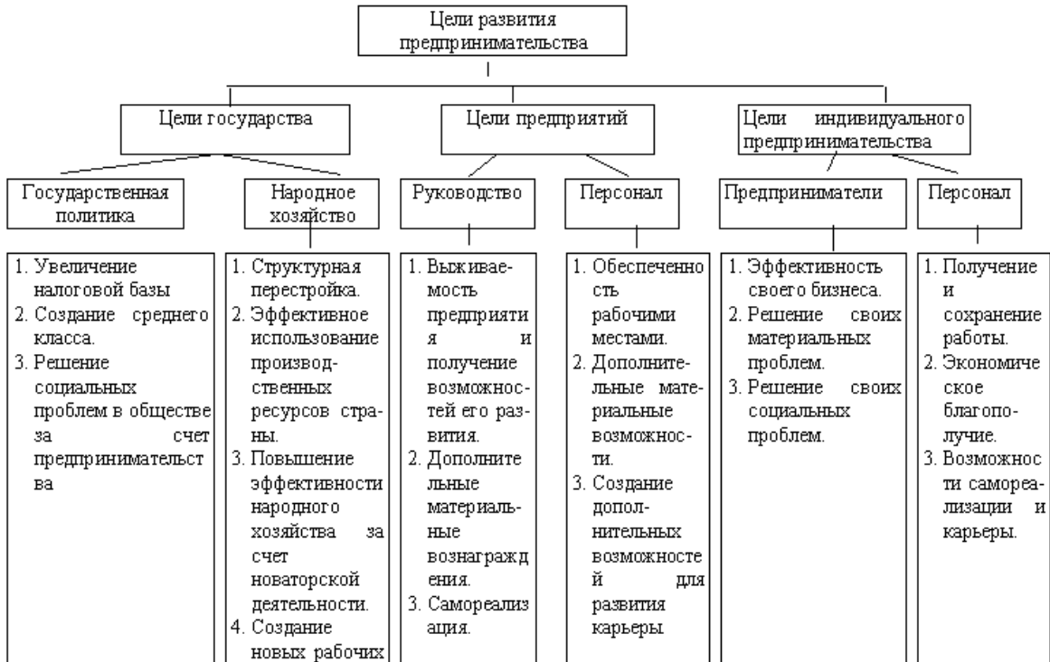
Рис.2.1. Цели развития предпринимательства