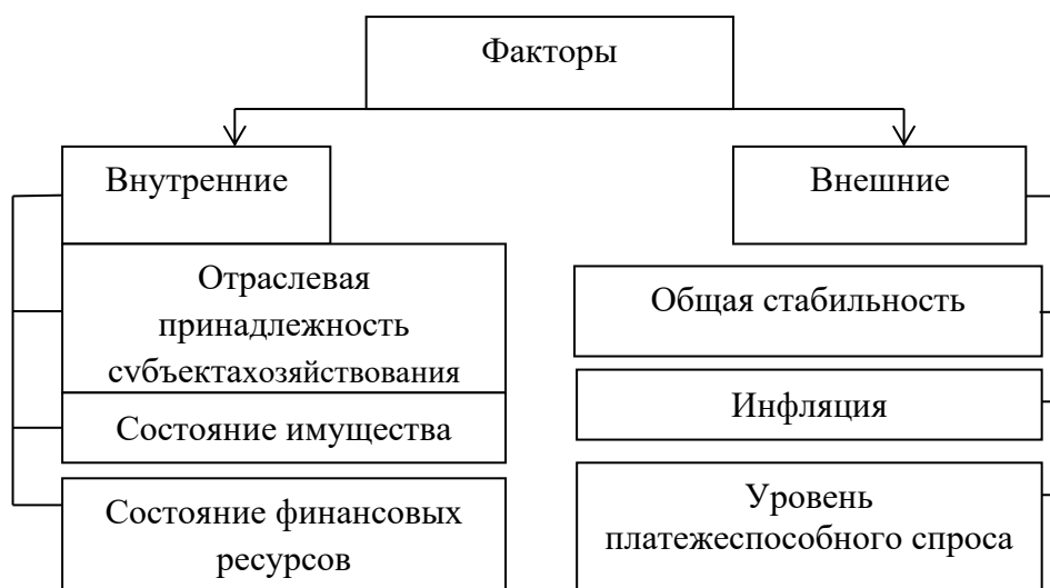
Рис. 1.1. Факторы, влияющие на финансовую устойчивость предприятия