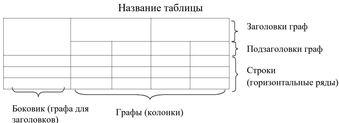
Рис.1.1. Структура и вид таблицы